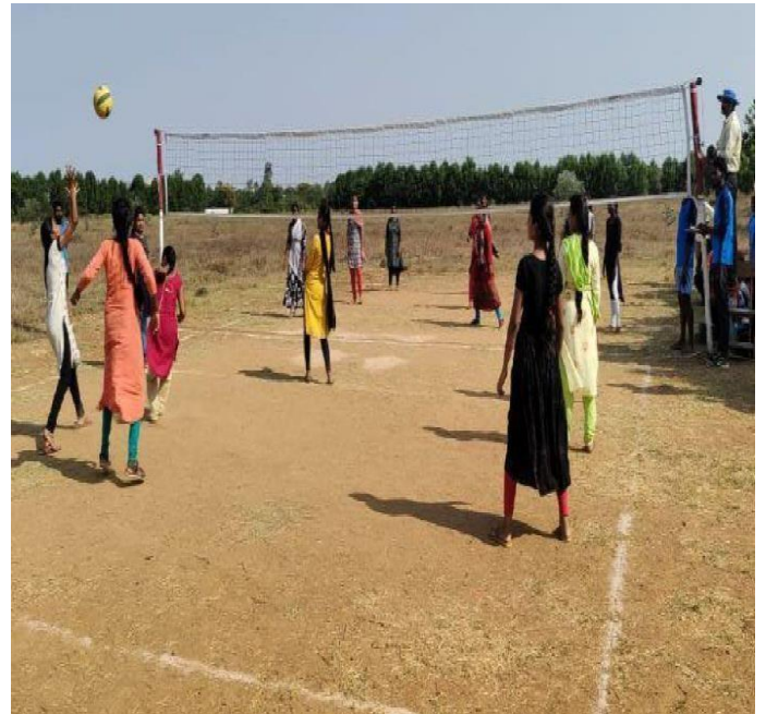
Women students playing Tennicoit and Through ball