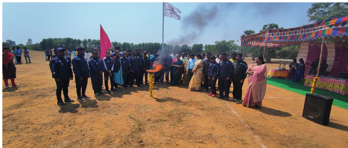
The Enthusiastic Sports Women at Marchfast