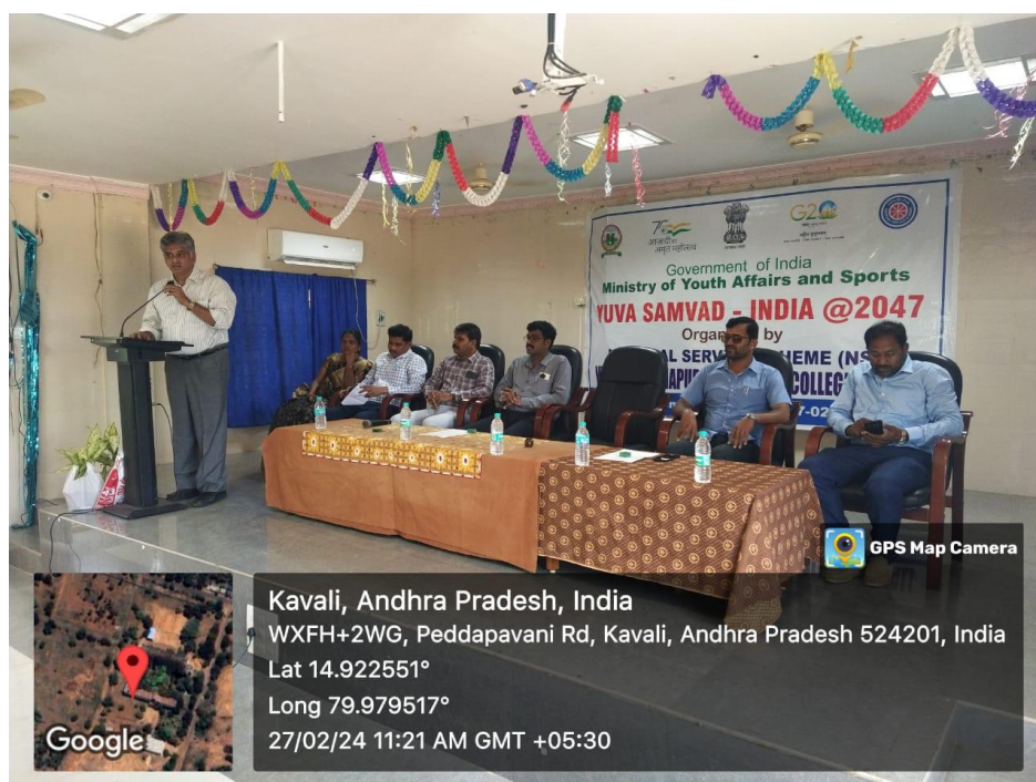
Principal VSU College, Kavali addressing the gathering