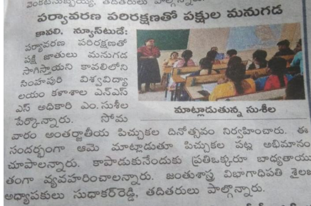
విక్రమ సింహపురి విశ్వవిద్యాలయంలో అంతర్జాతీయ పిచ్చుకల దినోత్సవం