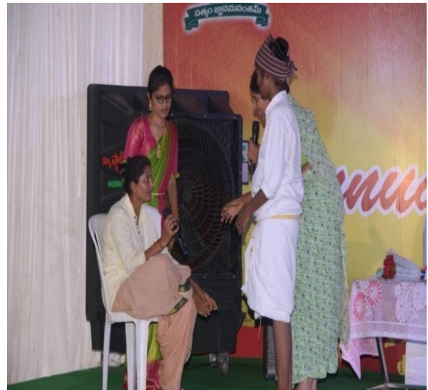
Skit by students on annual day