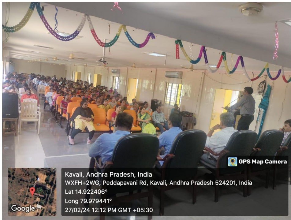
Guests addressing the gathering