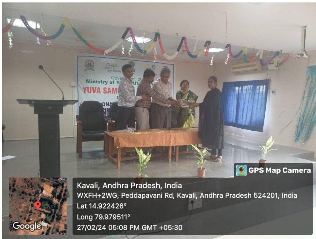
Prize distribution to the winners in the competition.