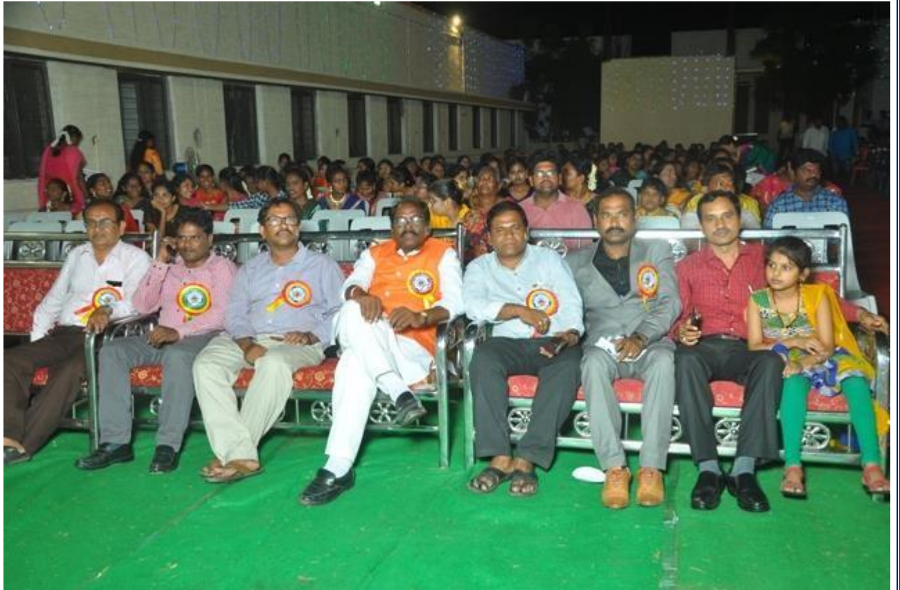
Circular on Cultural and sports competitions on the eve of annual day celebrations