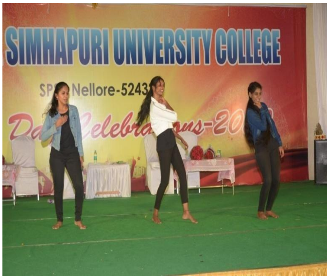
Dance by students on annual day