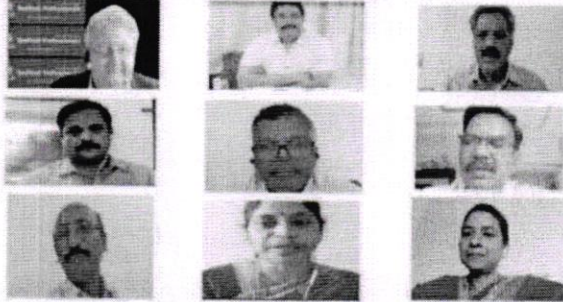
International Webinar on "COVID-19 Pandemic- Impact on Sustainable Fishery Sector and Global Trade (CPISFSG-2020)"