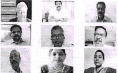
International Webinar on "COVID-19 Pandemic- Impact on Sustainable Fishery Sector and Global Trade (CPISFSG-2020)"