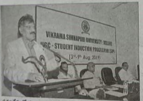
మువేశంలో మాబ్లాదుతున్న వీఎస్యాయా వైస్ట్ పాస్ట్ లర్ నుదర్చనరావు

ಬಾರ್ ರಾಶ್ ಮ ే ఉద్దమ యూచిన ಡಿ ಪ್ರಾಂದರಿ సంస్థలన్ ప్రాభికర్ ತಿರಿದೇರು ವಿಶ್ವವ ಚ್ರಾಕೆಲ್ ಗಾತರಂ ಭಸ ಪ್ರಥಮ ನಂತ ණ රාහම්ක්වැන් 03ro 306 edod sodg5 क्टार्टी के क्ट्रीड ನಿರ್ಧ ಬ್ಯಾಜಿನ ನಿವ್ ನರವು ಮಾಲ್ಲಾರುತ್ತೂ ంలోని అర్యుత్తమ