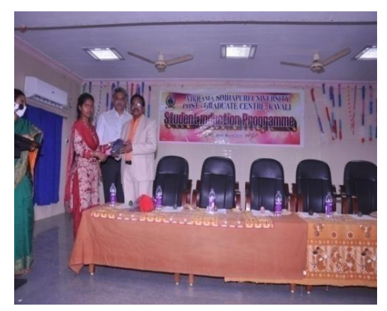
Welcoming invitees on to the Stage