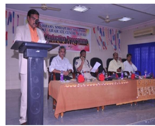
Welcoming invitees on to the Stage