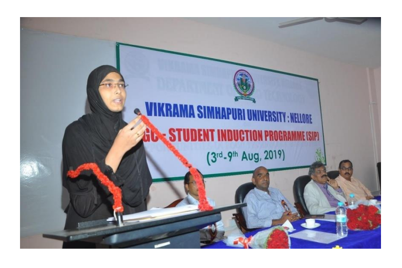
Students expressing their views on gender equality