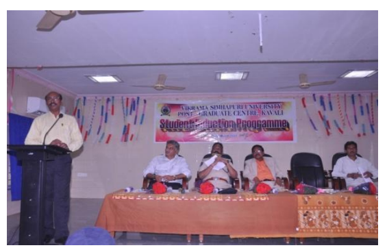
Address by the Chief Guest