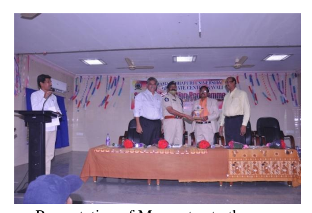
Presentation of Mementos to the Guests