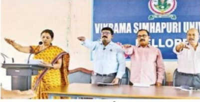
కాకుటూరు : ప్రతిజ్ఞ చేస్తున్న భృత్యులు