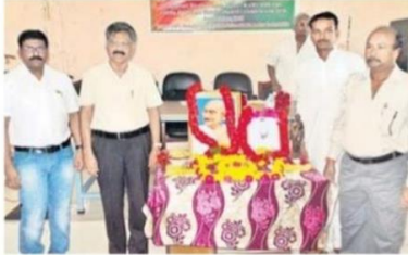
మహాత్మాగాంధీ, లాల్ బహదూర్ శాస్త్రి చిత్రపటాల వద్ద నినాకలర్చిస్తున్న వీసీ, తదితరులు