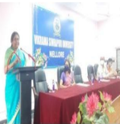
వెటరనరీలు మాట్లాడుతూ, ఓటు హక్కు అవసరమైన వారికి ఓటు హక్కు ఉంటుంది.