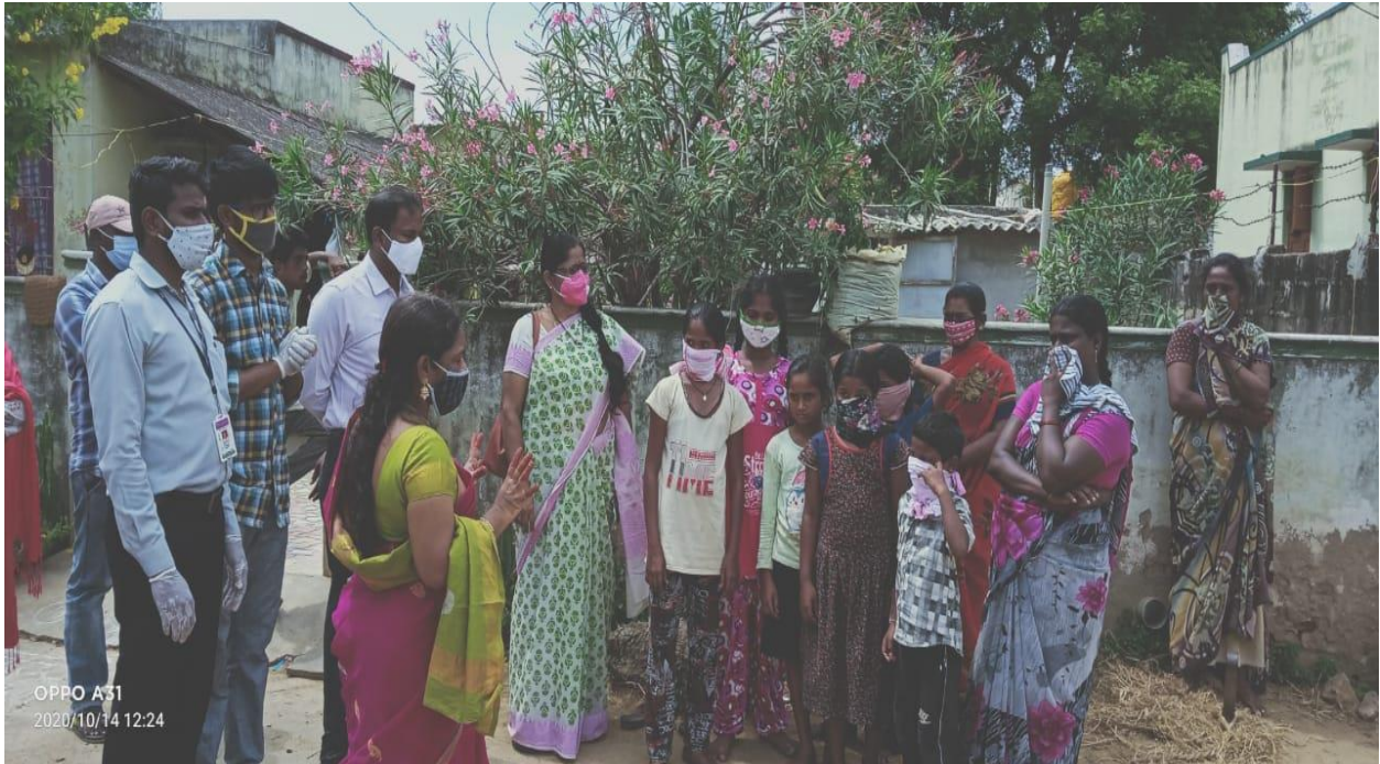
As part of Institutional responsibility the Students and Staff of VSU educating the neighbouring community people on importance of Mask Wearing and COVID Appropriate behaviour.