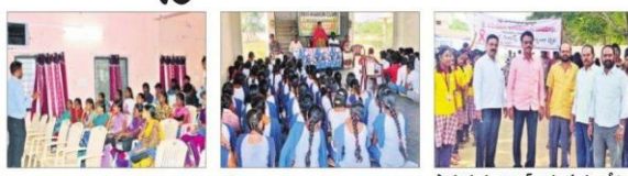
వెంకటాచలం : ఎయిడ్స్ వ్యాధిపై అవగాహన కలిగించే సేవపై సైద్దిరాజులు