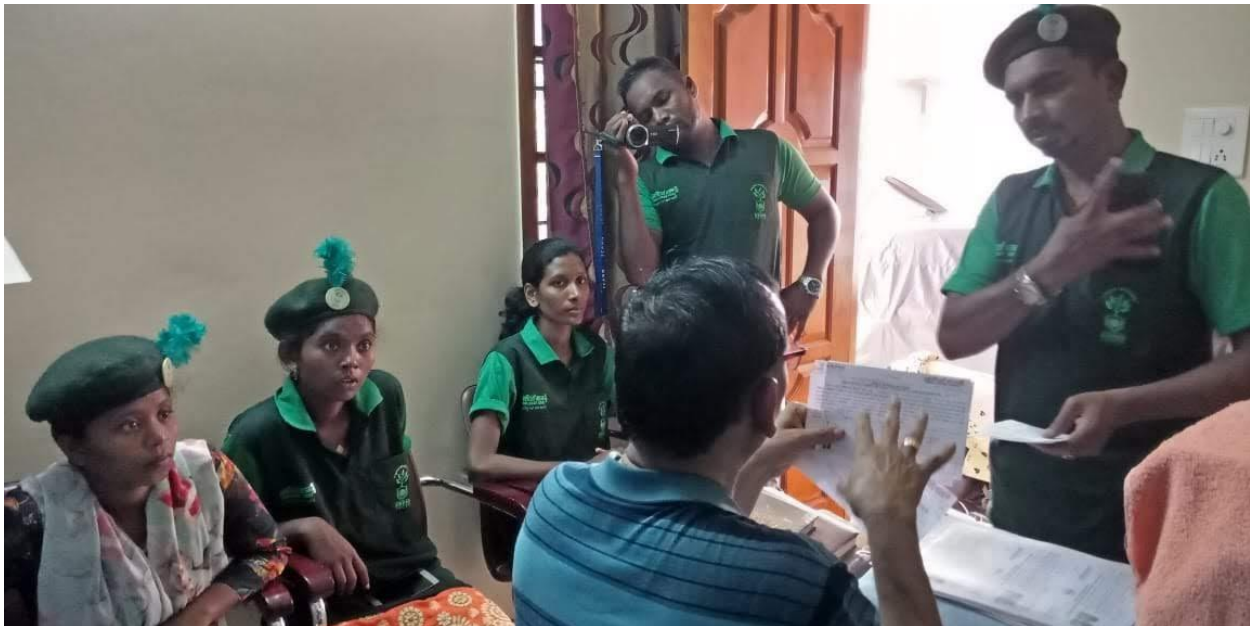
As green champions the students of VSU educating the community about Wellbeing out of Waste and also about Wet Waste and Dry waste bin maintenance significance among the public