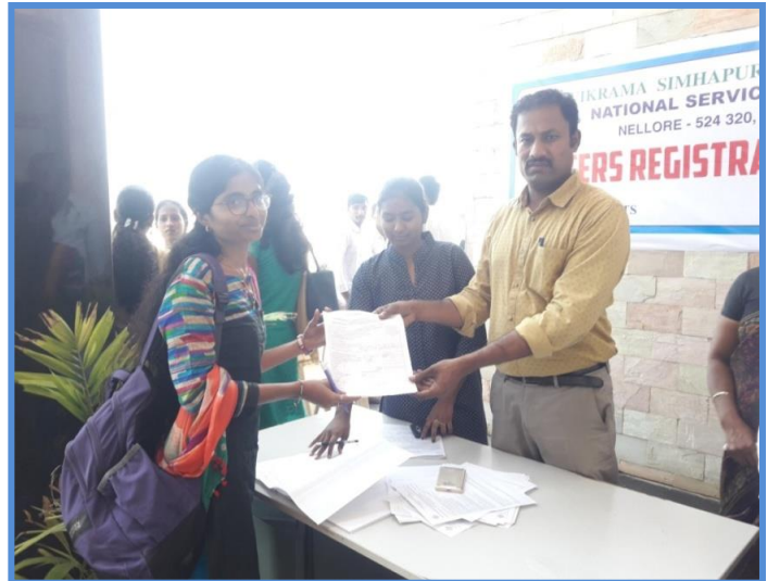
Giving of form -16 to newly enrolled students