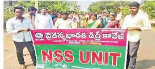
వెంకటాచలం : రాళ్ళి నిర్వహిస్తున్న విద్యార్థులు

విద్య వెరుకుారు(తోటపల్లిగూడూరు) : తోటపల్లిగూడూరు మండలం చిన్నచెరుకు గ్రామంలో శుభ్ర వారం జాతీయ ఓటర్ల దినోత్సవాన్ని పునంగా నిర్వహించారు. గ్రామంలో మహిళలకు ఆటల పోటీలు నిర్వహించారు. రాత్రి చేశారు. స్టానికంగా ఉన్న సీనియర్ ఓటరుకు సన్మానం చేశారు.