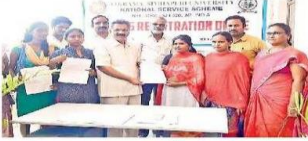
నమోదు పత్రాలు అందజేస్తున్న ఉపకులపతి