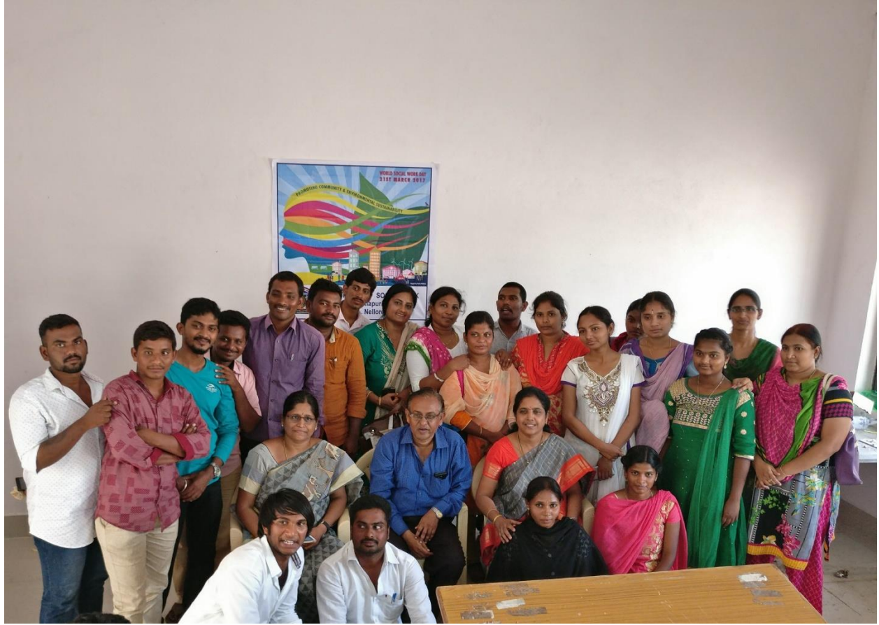
Enlightened the students on World Social work day-2017 and the theme that is responsibility of students in promoting the community and environmental sustainability