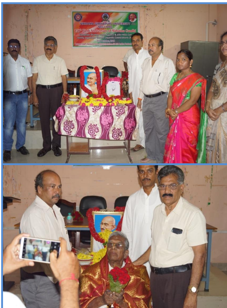
Felicitating the Guest on the Occasion