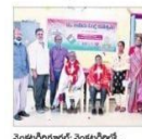
వెటరనరీలు మాట్లాడుతూ, ఓటు హక్కు అవసరమైన వారికి ఓటు హక్కు ఉంటుంది.

రాష్ట్రంలోని ఓటు హక్కు వినియోగించుకోవాలని అన్నారు. ప్రతి ఒక్కరూ తమ ఓటు హక్కును వినియోగించుకోవాలని అన్నారు. ప్రతి ఒక్కరూ తమ ఓటు హక్కును వినియోగించుకోవాలని అన్నారు.