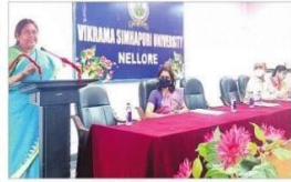
వెటరనరీలు మాట్లాడుతూ, ఓటు హక్కు అవసరమైన వారికి ఓటు హక్కు ఉంటుంది.

వెటరనరీలు ఓటు హక్కు ప్రజలకు వజ్రాయుధం అంటే అర్థం ఏమిటో తెలియజేసే ఉద్దేశ్యంతో విద్యార్థులకు అవసరమైన ఓటు హక్కును గురించి వివరించారు. వెటరనరీలు అవసరం కాక బయటో విద్యన సాధించి దీర్ఘకాలం అధ్యయనం చేసిన వారికి ఓటు హక్కు ఉంటుంది. ఈ సందర్భంగా ఆపి మాట్లాడుతూ 18 సంవత్సరాలు నిండిన ప్రతి ఒక్కరూ తమ ఓటు హక్కును వినియోగించుకోవాలని అన్నారు. ప్రతి ఒక్కరూ తమ ఓటు హక్కును వినియోగించుకోవాలని అన్నారు.