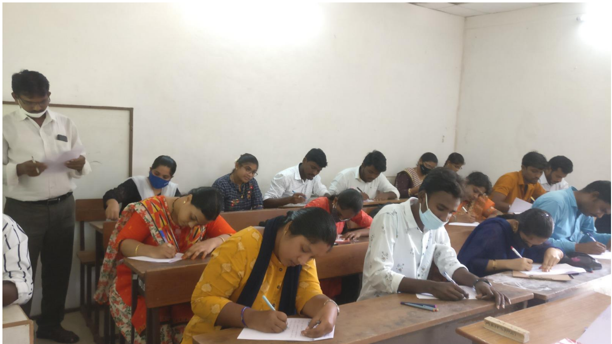
Essay writing competitions on constitution day