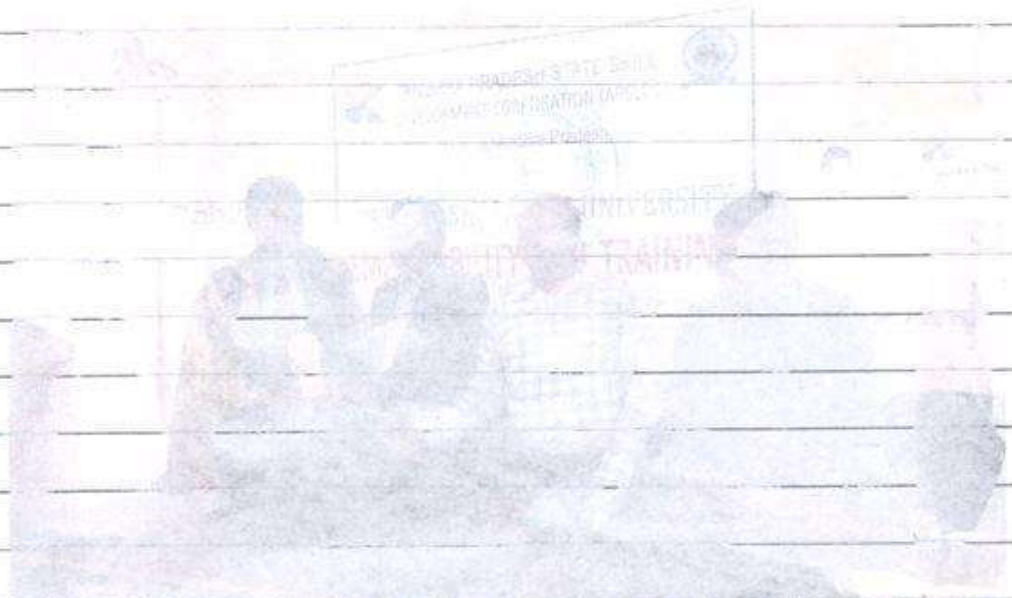
PARTICIPANTS IN EMPLOYABILITY SKILL TRAINING